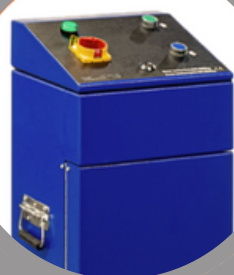
Table élévatrice :